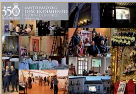
PUBLICIDAD DE ACTIVIDADES REALIZADAS PARA CONMEMORAR LOS 350 AÑOS DE «LA ESCALERA».

La Hermandad ha querido implicar a todos los riosecanos en la participación de los diferentes actos programados, que se pretende sirvan como homenaje y reconocimiento a todos aquellos que fueron hermanos a lo largo de la historia, en acción de gracias por transmitir el legado del Paso y las tradiciones. Un variado programa hasta el próximo junio que incluye eventos religiosos, campañas de caridad o solidaridad y actividades cultura-