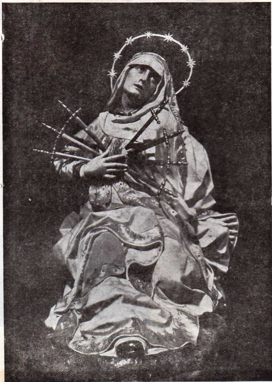
La Dolorosa (de Juni), procesión del Lunes Santo.